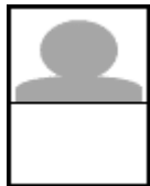
縦横の比率があていないもの