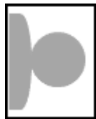
写真が横向きになっているもの