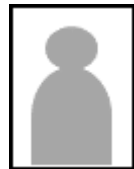
全身写真になっているもの