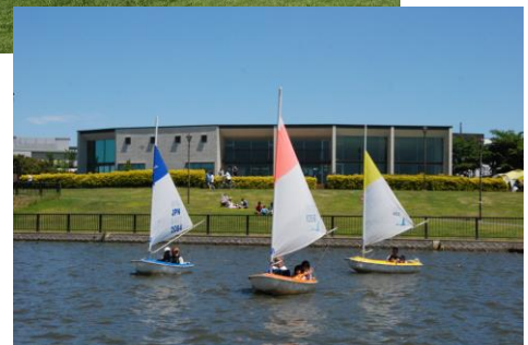
越谷レイクタウン