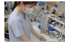
看護師 堺市中区出身

症例が多く、仕事の幅が広いということと、飼い主様との距離が近く、院内の雰囲気よかったことからげんき動物病院に就職しました。まだ、働き始めてから長くはないですが、院長も優しく、勉強熱心な方なので、技術や知識も積極的にわかりやすく指導してもらっています。前回の来院時はぐったりしていた子が、次に来院されたとき元気になっている姿を見るとやりがいを感じます。また、休憩がしっかり取れ、週2.5日休でプライベートとも両立させることができ、働きやす職場だと感じています。