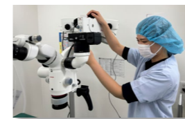
看護師 堺市中区出身

症例が多く、仕事の幅が広いということと、飼い主様との距離が近く、院内の雰囲気よかったことからげんき動物病院に就職しました。まだ、働き始めてから長くはないですが、院長も優しく、勉強熱心な方なので、技術や知識も積極的にわかりやすく指導してもらっています。前回の来院時はぐったりしていた子が、次に来院されたとき元気になっている姿を見るとやりがいを感じます。また、休憩がしっかり取れ、週2.5日休でプライベートとも両立させることができ、働きやす職場だと感じています。