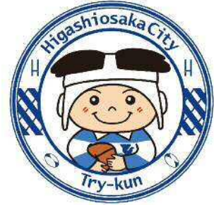
東大阪市マスコットキャラクター 「トライくん」