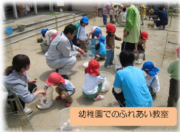
幼稚園でのふれあい教室