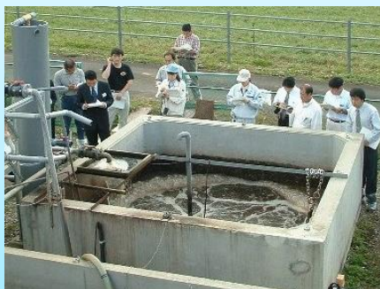
低コスト汚水処理施設の開発