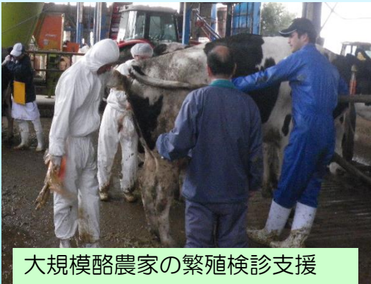
大規模酪農家の繁殖検診支援