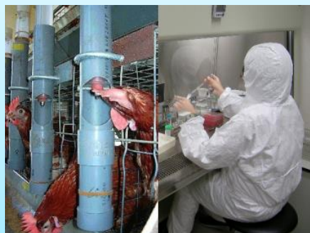
畜産物の安全性に関する試験