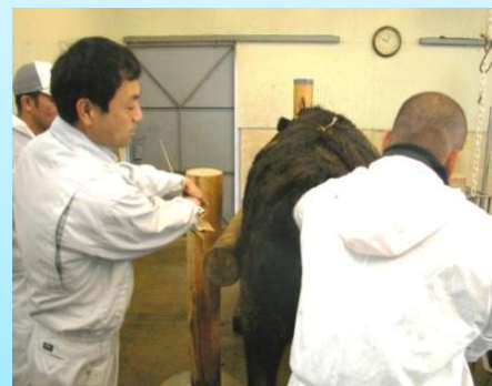
人工授精師の養成講習