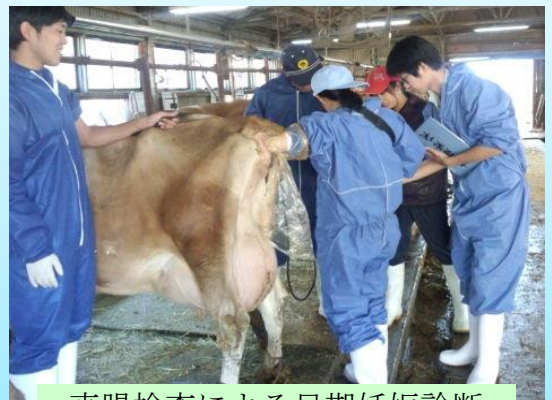
直腸検査による早期妊娠診断