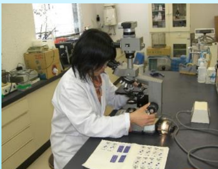
畜産物生産技術の開発