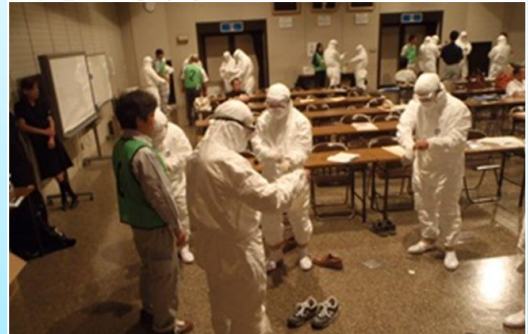
高病原性鳥インフルエンザ防疫演習 防疫服の脱着訓練