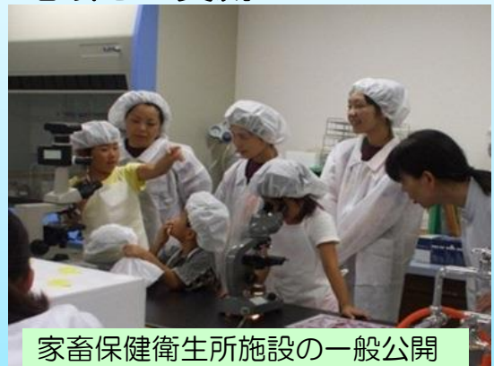
家畜保健衛生所施設の一般公開