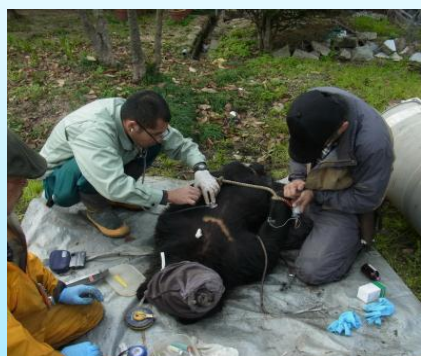
ツキノワグマの試験研究 (不動化し、計測)