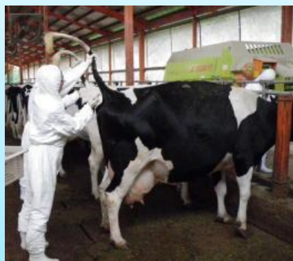
牛ブルセラ病検査の採血