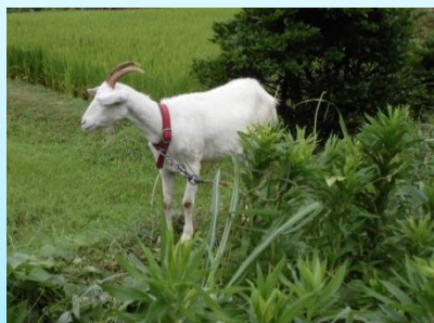
耕作放棄地でのレンタヤギの放牧技術指導