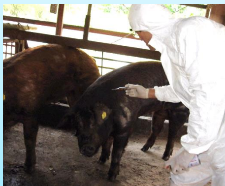
豚への流行性脳炎予防接種