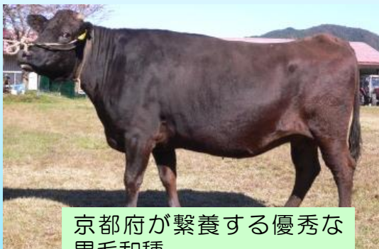
京都府が繋養する優秀な黒毛和種