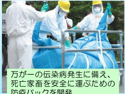
万が一の伝染病発生に備え、 死亡家畜を安全に運ぶための 防疫バックを開発