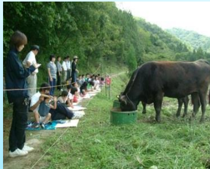
レンタカウの写生大会