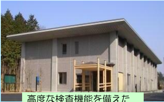
高度な検査機能を備えた 中丹家畜保健衛生所