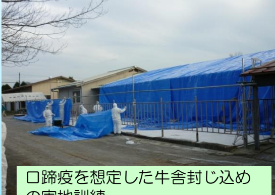
口蹄疫を想定した牛舎封じ込め の実地訓練