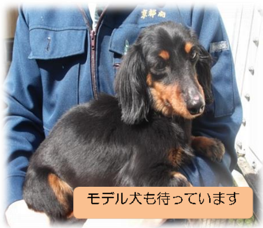
モデル犬も待っています