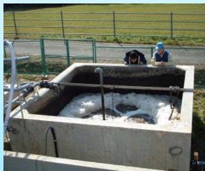
環境対策技術の開発