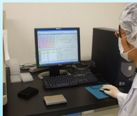
牛ヨーネ病の遺伝子検査