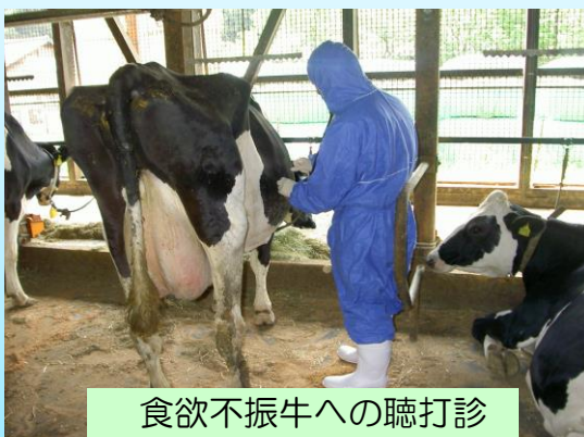
食欲不振牛への聴打診