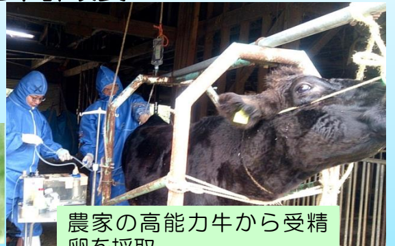
農家の高能力牛から受精卵を採取