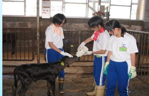
地元中学生の牧場体験学習