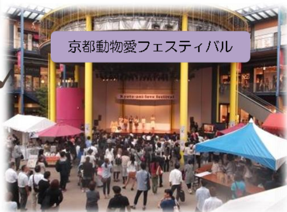
京都動物愛フェスティバル

公務員獣医師の業務とは、「ペットの病気を治す」、「新薬を開発する」といった苦勞の中にも華々しさがある！という仕事ではなく、ひたすら裏方に徹するものです。