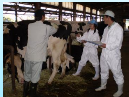
酪農後継者への技術支援