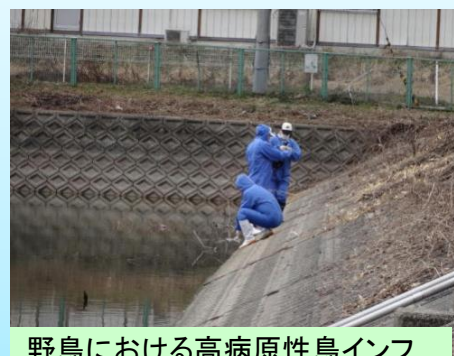
野鳥における高病原性鳥インフルエンザサーベランス調査の実施(野鳥(カモ類)の糞便採取)