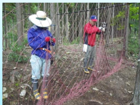
ニホンジカ捕獲の方法の試験研究 (試験用の柵の設置)