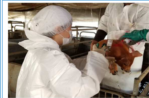
離乳豚へのCSFワクチン接種