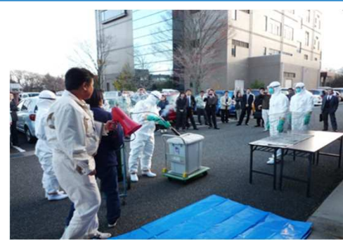
高病原性鳥インフルエンザ防疫演習

山梨県 福祉保健部 福祉保健総務課 総務経理担当 TEL 055-223-1441 農政部 農政総務課 総務経理担当 TEL 055-223-1581 〒400-8501 甲府市丸の内1丁目6-1 http://www.pref.yamanashi.jp