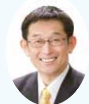
明石市長 (弁護士・社会福祉士)

全国どこからでもご応募いただいてもかまいません。ぜひ、ご応募、お待ちしております。