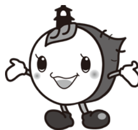
川越市マスコットキャラクターときも