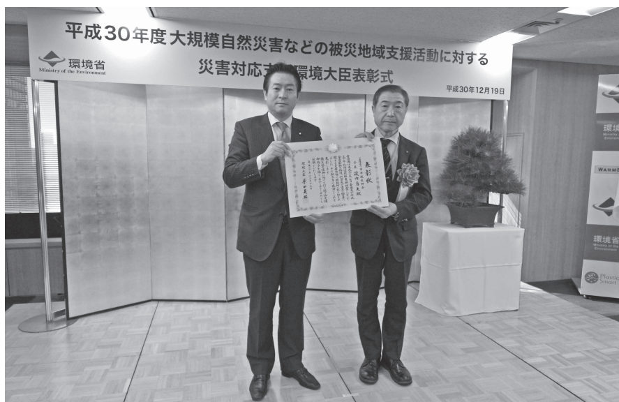
図1 左より、あきもと司環境副大臣、本会専務理事

「被災地におけるペット対策」では、日本獣医師会、北海道獣医師会、岡山県獣医師会、広島県獣医師会、愛媛県獣医師会、他2団体が表彰対象となり、平成30年12月19日、環境省第1会議室において表彰式が行われ、原田義昭環境大臣から挨拶の後、あきもと司環境副大臣から各受賞者へ表彰状等が授与された（図1～3）。