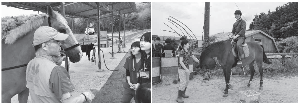
Fig 3 (図3)

It was able to visit the laboratory of reproduction in University of Miyazaki and to join their clinical works and experiment. There was another appreciable chance to visit Kagoshima University and to look around their facilities (Fig 5).