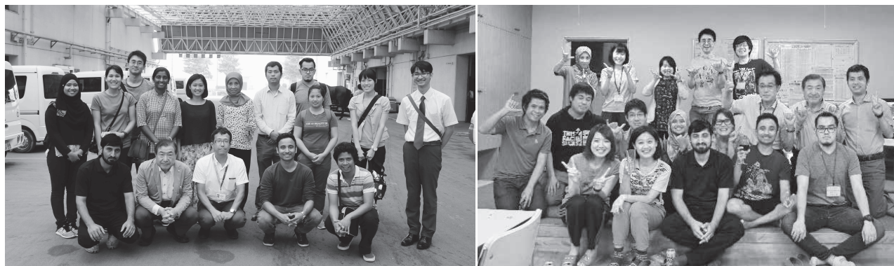
Fig 6 (図6)

The Training program for Asian Veterinarians (TP-FAV II) for one year was not so long period to experience livestock industry and cultural life of Japan. During that time, however, it was able to learn various things. The physical environment including cattle farms and laboratories in Japan were very similar with Korea, and I could realize that most of them in Japan were managed well in the manner of themselves. That's what I feel most impressively for the past one year, and it was quite good experience incomparably to make observations of the way to deal with problems systemically. I hope that there is