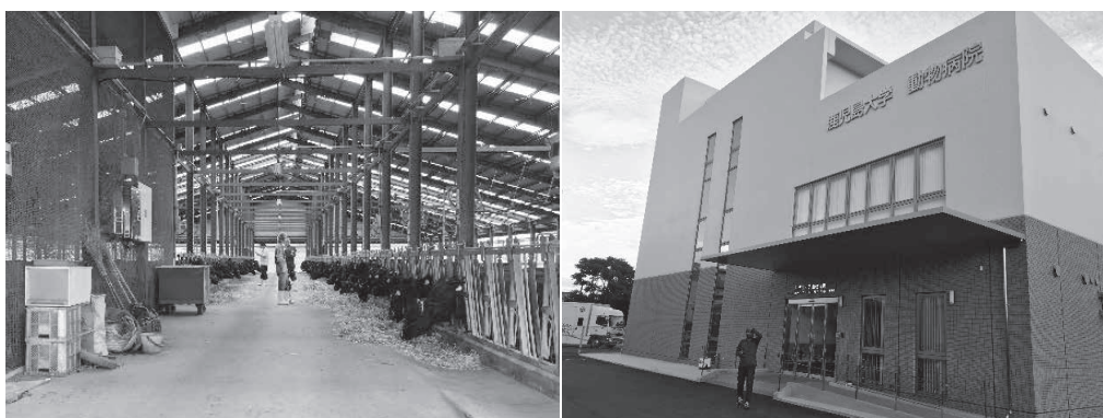
Fig 5 (図5)

夏期全体研修では日本の文化、日本の畜産業にかかわる教育施設、産業構造についてよく学ぶことができました。畜産業にかかわる施設の見学、また動物用医薬品製造会社、中央競馬、動物検疫所といった施設の見学ができました。民間農場で生産される乳製品が印象的でした。またJRAの設備が整った動物病院、その他の獣医学関連施設を訪れたことで有益な情報が得られました(図6)。