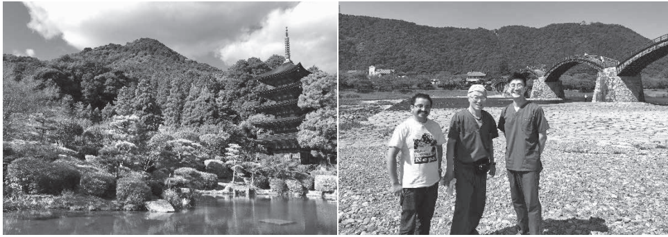
Fig 7 (図7)

another chance to visit Japan again, whatever the purpose is, and it would be able to feel and learn values more deeply. Furthermore, I'm expecting continuous relationship and cooperation among livestock veterinarians in the Asian countries. Finally, I really appreciate all of the members of the Japanese Veterinary Medical Association and the professors of the Yamaguchi University.