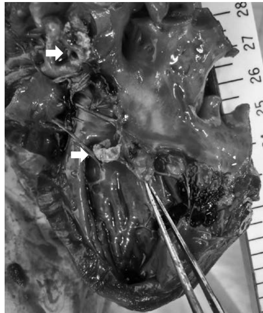
図3 僧帽弁にみられた疣贅物 (矢印)