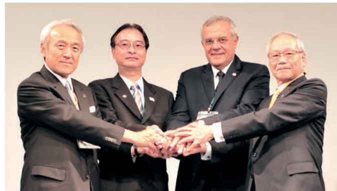
平成28年11月11日福岡県北九州市において調印。 写真左から、藏内勇夫 日本獣医師会会長、ジョンソン・チャン 世界獣医師会次期会長、ザビエル・ドゥー 世界医師会元会長、横倉義武 日本医師会会長。